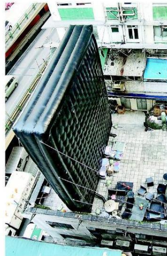
本報昨在高空觀察，發現冠景樓3樓平台的充氣招牌由多條繩索固定在建築物上，底部放有數個沙包，後方則有多個膠箱。招牌雖然體積龐大，但無阻塞出入口。

【明報專訊】灣仔堅拿道天橋旁一幢舊樓的3樓平台，近日擺放約3層高巨型充氣廣告招牌，由繩索繫在樓宇固定，市民憂慮危及道路安全。有測量師指充氣招牌有安全風險，惟它不屬建築物，在監管上有灰色地帶。