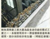
解魚涌康華工業大廈為最多迷你倉的舊式工廈之一，本報發現其中一層樓樓梯道佈滿煙燻，部分消防栓亦有生鏽。

九龍灣淘大工業村迷你倉 6 月 21 日晚發生四級火，行將一個月過去，消防處快將完成全港約百餘舊式迷你倉工廈（即 1973 年前落成、法例無要求裝灑水系統工廈）的巡查工作，這已是繼 2008 年和 2010 年後政府第三次大規模巡查舊式樓宇的消防安全。本報蒐集迷你倉分佈地點及透過查冊，發現近 91 幢有迷你倉的工廈中，三分之一已因消防及僭建等問題而被屋宇署釘契多年，當中部分迷你倉被查封閉成數百個儲倉，消防設備嚴重不足，安全隱患更無法根除。明報記者