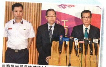
發展局局長陳茂波(右一)表示，港府取締利用工廠作非工業用途的單位。

署理消防處處長曾永鴻指，現時全港約有二百幢工業大廈有危險品倉庫牌照，在有危險品倉庫的工廠的火警危險會較一般工廠為高，如大廈內有吸引大量人流的其他未獲批准用途，便會對出入的公眾造成很大危險，如在危險品倉庫人貨進出時，更會與使用同幢工廠的兒童共用使用同一個升降機大堂或樓梯。測量師學會前會長何鉅業表示，現時很多舊工廠均改為非工業用途，部分較為混亂和複雜，包括活動場所、興趣班甚至大型遊戲場地，吸引大量人流，並指如政府日後進行多輪執管行動，人手不足夠，可借助業界力量。他又分析，部分工廠活化轉為商廈區，提供更優越空間，但租金成本無可避免增加，而舊工廠空間即使執法加強，亦不會完全沒有供應。