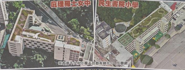
香港不少中小學校都有綠化。