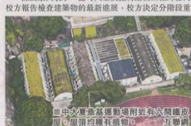
中大夏基基運動場附近六間鐵皮屋，屋頂均有種植植物。互聯網

查詢時表示，任何影響結構的改動均要入則，根據傳 媒提供胡法光運動中心設計圖及數據，若在天花放 置泥土，會影響建築頂部排水速度，若大雨令難以 排走雨水，屋頂有機會倒塌，他認為除非加上強鋼 架，否則不適合在頂部進行加建。 陳國華又表示，認可人士及註冊結構工程師已向 校方報告檢查建築物的最新進展，校方決定分期重