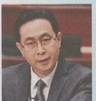
署理發展局局長馬紹祥出席立法會回應議員的緊急質詢。

城大運動中心屋頂倒塌事件 已發生六日，針對綠化天台工程 是否需入則等問題，署理發展局局長馬紹祥表示，屋宇 署計畫於本週內急發新指引，讓外界了解何 種需要跟進的高風險綠化工程，但對於個別 項目需否入則，馬紹 祥承認屋宇署難以就 每個項目訂出「硬指 引」。建築署將分階 段按風險檢查政府綠 化天台設施，並已檢 查四幢與城大類似的 大跨度金屬支架綠化 屋頂，證實安全。