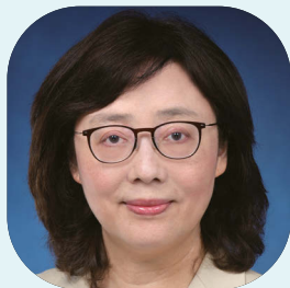
甯漢豪女士，JP 中華人民共和國香港特別行政區政府 發展局局長