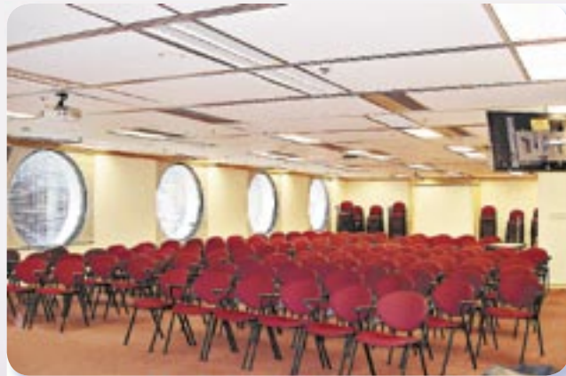
位於香港測量師學會總部的測量師研習中心，是為會員提供培訓的理想地點。

地址：香港中環康樂廣場1號怡和大廈 8樓801室 電話：(852) 2526 3679 傳真：(852) 2868 4612 網址：http://www.hkis.org.hk 電郵：info@hkis.org.hk