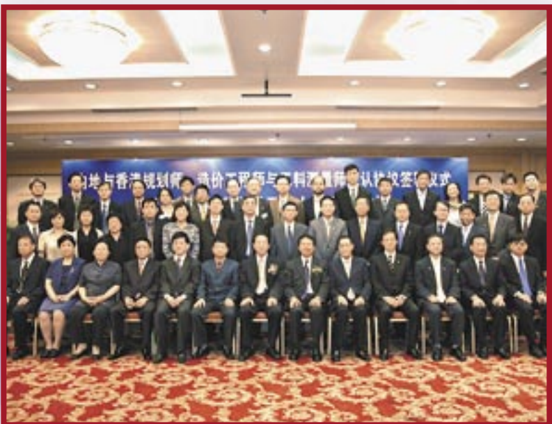
▲ 經過3年磋商，學會與中國建設監理協會簽訂互認資格同意書，雙方可進行考察及獲得對方的會籍。