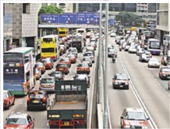
▲ 港島部分地區的交通擠塞情況嚴重，學會亦期望政府能多建造運輸基建，以維持香港的競爭力。