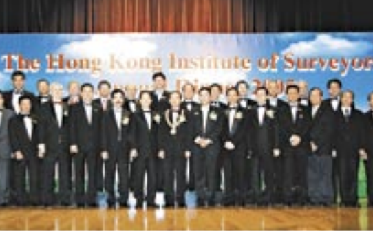
▲ 學會每年舉辦周年晚宴，是為了總結學會過去一年的成績，並鼓勵會員向前邁進。上圖為去年晚宴盛況，並邀得行政長官曾蔭權（左圖）任嘉賓。

民政府建設部和廣東省人民政府港澳事務辦公室等官員進行了很多有效果的商談。學會希望能早日把所有在「更緊密經貿關係安排」下訂下的計劃和放寬措施具體化，實現加強香港測量師在內地房地產和建造業市場的參與能力。