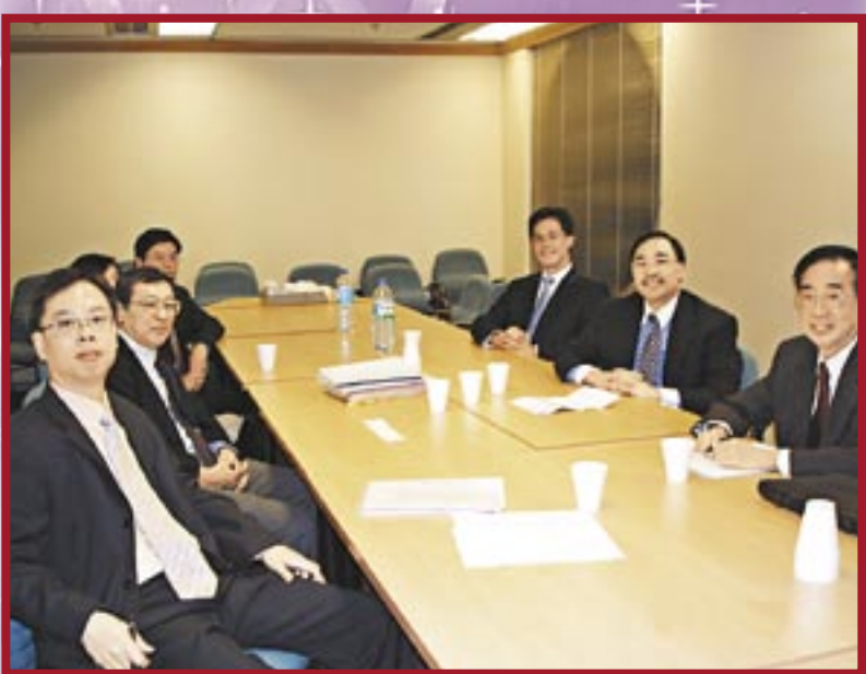
▲ 日本代表也曾到訪學會，作專業交流。