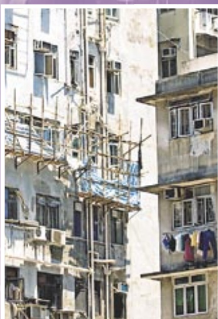
◀ 「強制驗樓計劃」是推廣減少樓宇維修及安全問題的預防性做法，亦為學會所支持。