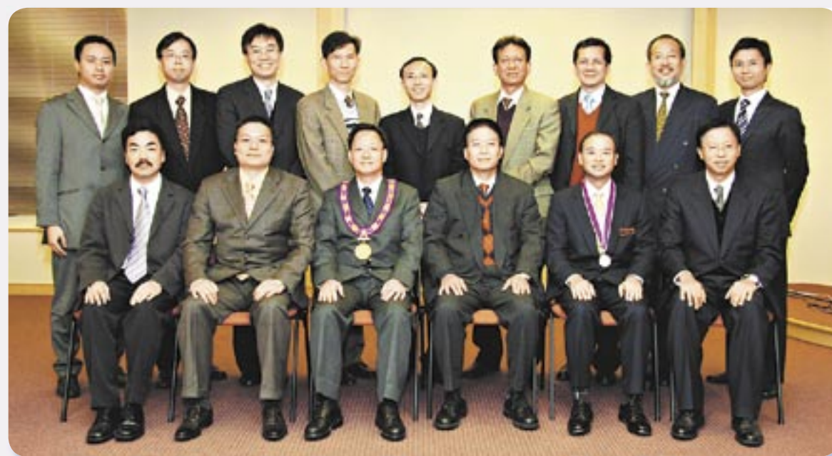
香港測量師學會05至06年度理事會成員合照。

展、以至礦務及等各類工程上提供初步成本諮詢計劃、招標書的制定及相議承包價、建築合約的制定和管理、工程費的開支預算及成本控制、工程策劃及管理、仲裁建築合約糾紛和建築工程保險損失估價等等。