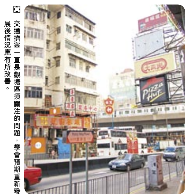
交通擠塞一直是觀塘區須關注的問題，學會預期重新發展後情況應有所改善。

現時的觀塘市中心建於1960年代。一般而言，這個有逾40年歷史的市中心在設計上已過時，無法適應