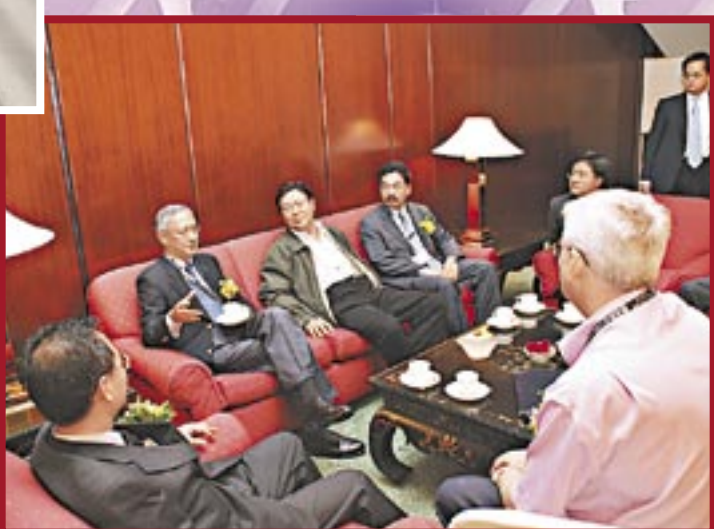
◀ 周年大會匯聚行業專才，作交流和分享。

總結來說，為求達致盡心盡力為會員和社會大眾服務的目的，學會又再經歷豐富的一年。學會今年所做的工作，希望能夠在社會上引起適度的關注，並鼓勵學會會員，今後繼續追求和達致更多的目標。