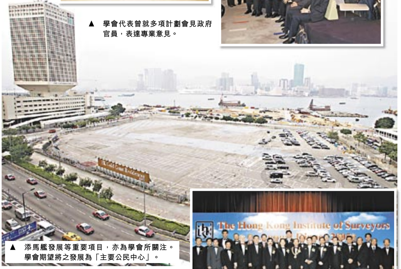
▲ 添馬艦發展等重要項目，亦為學會所關注。學會期望將之發展為「主要公民中心」。