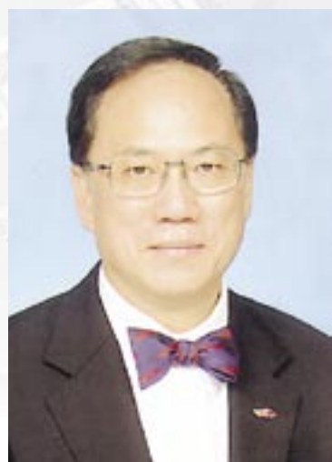
香港特別行政區 行政長官 曾蔭權